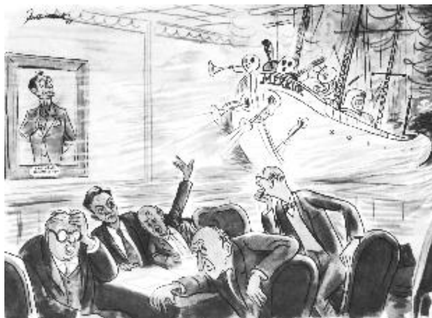
“Den flyvende poplænder” Fortvivelse i Rosensønsallé: Musikradioen er vedtaget. Rådet havde travlt med at forklare, at den nye musikradio var noget helt andet og finere end Radio Mercur (Jenssenius Politiken 1963)

Men så vendte bøtten. De glade P3 - dage fra tredsernes midte var ikke glemt. Lytterne krævede dem tilbage. Rådet gjorde klar der et helt nyt P3-koncept, der siden dengang kører løs døgnet rundt.