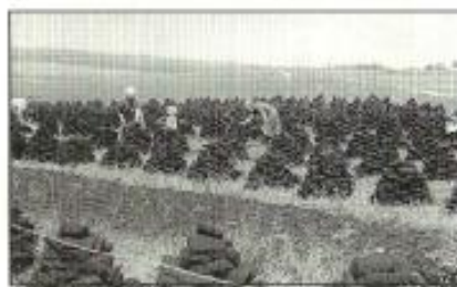
Tørv lægges til tørre og stables i Rorup Mose

I 1940 kom krigen. Der blev mangel på brændsel, og PJ startede som mange andre en tørvefabrikation. Han startede med at grave tørv ved Adser Mølle og