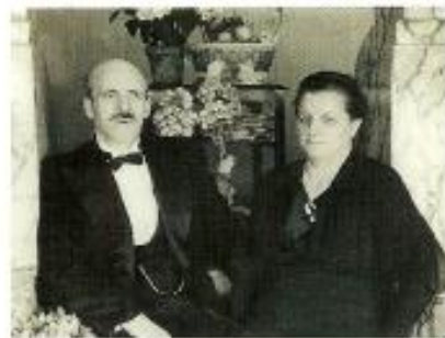
PJ's sølvbryllup 26/4 1939

Han boede hele sit liv i Aavang. Han blev malermester i Aavang i 1912. Som malermester havde han på et tidspunkt en stor virksomhed med 12 svende. Han stod blandt andet for malingen af