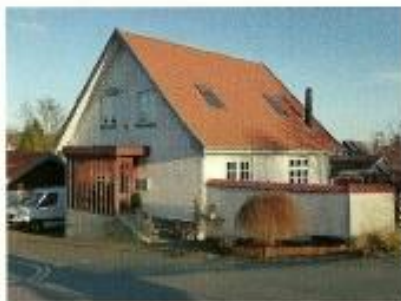
Vinkelvej 11 (nu 13), Aavang, som var hjemsted for Lejre Radio-Central.