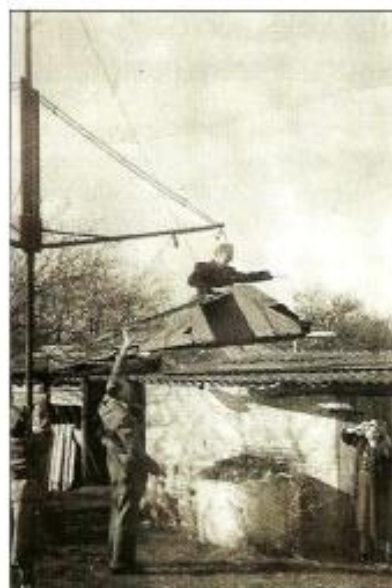
Karrusel med to flyvemaskiner

En af PJ's ideer var en roulette. Den blev udført af Johannes Jeppesen på Lejre Maskinfabrik efter PJ's tegning. Det blev en flot roulette, og den var ikke billig. Den blev opstillet ved et