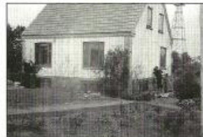
Rodriohuset på Vinkelvej. Vindmøllen i baggrunden